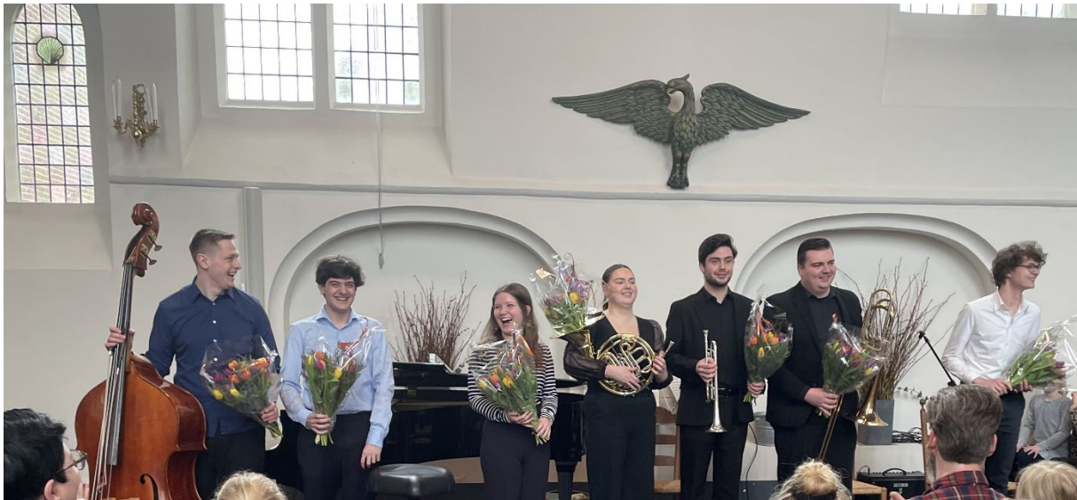
Musici schoolconcert 29 maart 2023

De kwaliteit en variëteit van het programma is gerealiseerd door de keuze van uitvoerenden en de programma's. Ook in 2023 hebben wij onze doelstelling kunnen realiseren en hebben wij ons publiek een goed programma aangeboden. Van ons publiek ontvangen we vaak enthousiaste reacties over onze mooie en gevarieerde programmering. Gedetailleerde informatie over elk concert is te vinden onder het kopje: 'Overzicht concerten in 2023'.